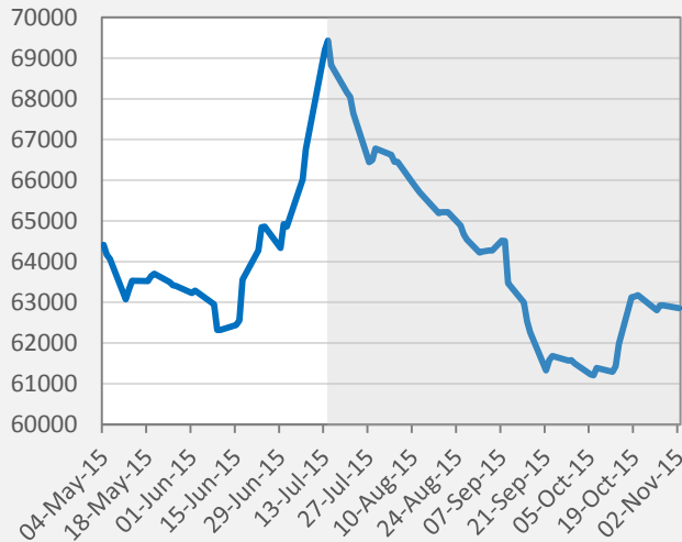
Fig 1. Iranian stock exchange (Tedpix All-share) 04-May-15 to present