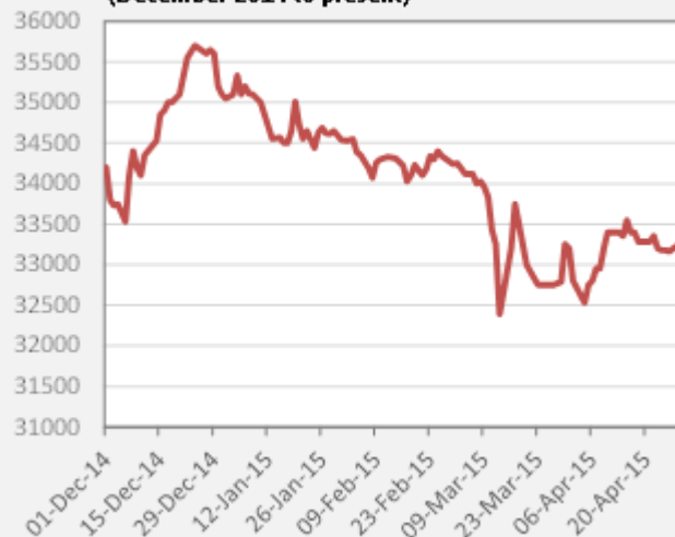
Fig 2 Rial:USD exchange rate (market and official) (December 2014 to present)